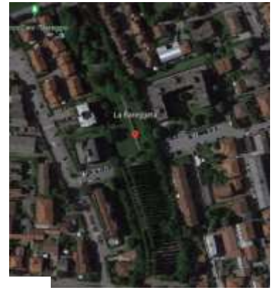
Figura 3 Parco La Baretta