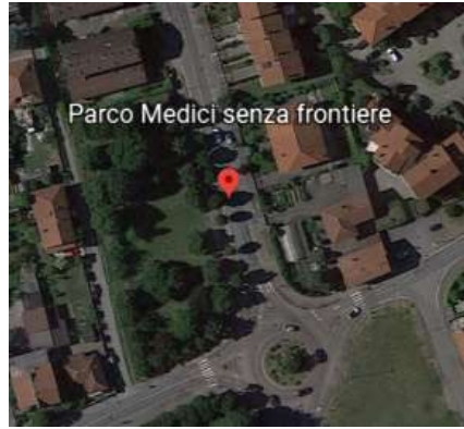
Figura 2 Parco Medici senza Frontiere