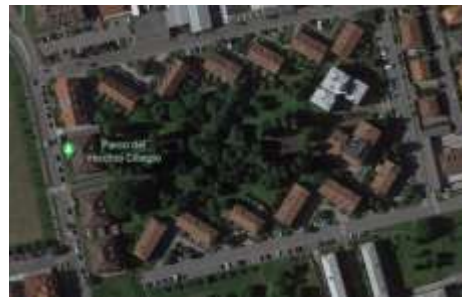
Figura 5 Parco Vecchio Ciliegio