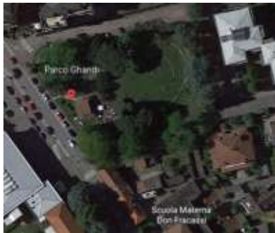
Figura 4 Parco Ghandi