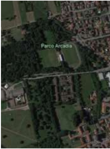
Figura 1 Parco Arcadia