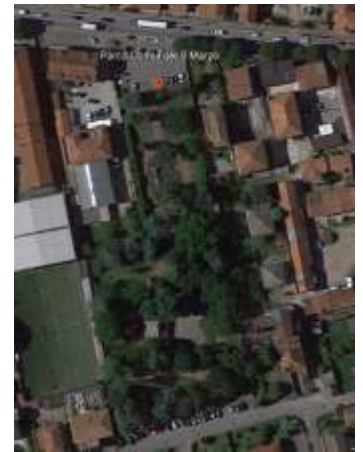
Figura 6 Parco 8 Marzo